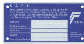
Beispiel für Typenschild ECB•S - Tresore

Bewahren Sie Ihre Schlüssel sorgfältig auf! Bei Verlust muss der Tresor gewaltsam notgeöffnet werden, was für Sie mit hohen Kosten verbunden ist. Wir haften nicht für den Verlust Ihrer Schlüssel. Bei Verlust eines oder mehrerer Schlüssel muss das Schloss aus Sicherheitsgründen gegen Kostenübernahme ausgetauscht werden, da sonst der Versicherungsschutz erlischt. In diesem Fall wenden Sie sich bitte an Ihren Tresorlieferanten oder nehmen Sie mit der unten stehenden Adresse Kontakt auf.