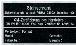
Beispiel für Typenschild VDMA - Tresore