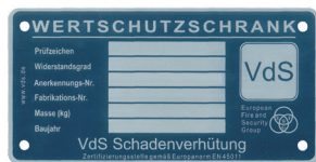
Beispiel für Typenschild VdS - Tresore

Bei Tresormodellen mit den abgebildeten Typenschildern können aus Sicherheitsgründen Schlüssel nur nach Vorlage eines Originalschlüssels angefertigt werden. Weiterhin muss die nachstehende Kundenerklärung ausgefüllt werden.