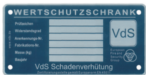
Example for a label VdS-safes

For safe models with one of below shown nameplates, we only issue a key if we have an original key. Furthermore, the customer declaration (see below) must be completed and attached.