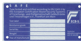
Example for a label ECB•S-safes

Keep your keys carefully! In case of loss, the safe must be opened by force, which is associated with high costs. We are not liable for the loss of your keys. If you lose one or more keys, for security reasons the lock must be replaced against invoice, because of insurance cover. In such a case, please contact your safe supplier, or contact below mentioned address.